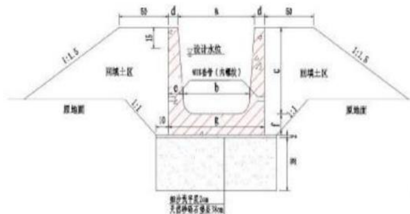
图 2-1 渠道断面设计

整体采用预制混凝土渠道，均采用 C35 预制砼板，厚 6cm~10cm，底板下设下为 2cm 细沙找平层，下设砂砾石垫层 38cm 厚。