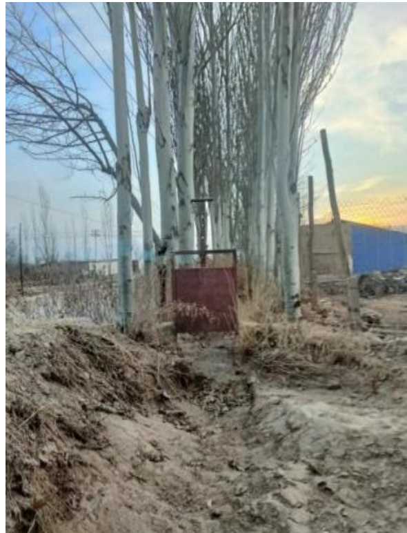
项目所在区域现状