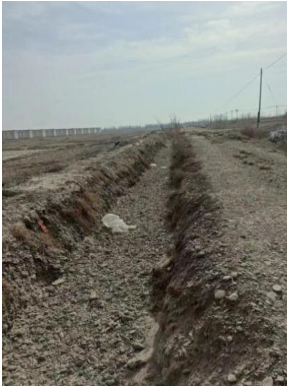
项目所在区域现状