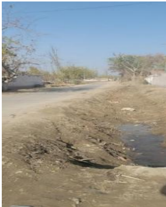
项目所在区域现状