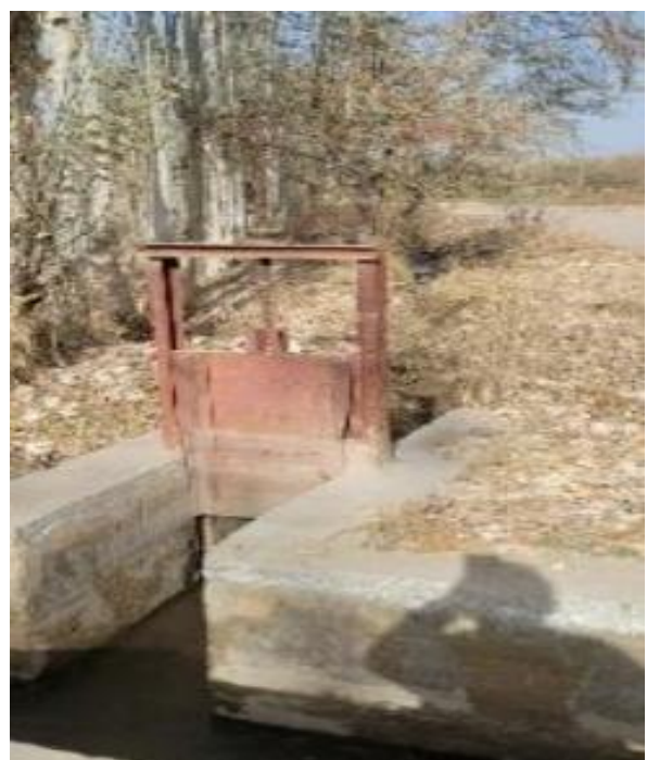
项目所在区域现状