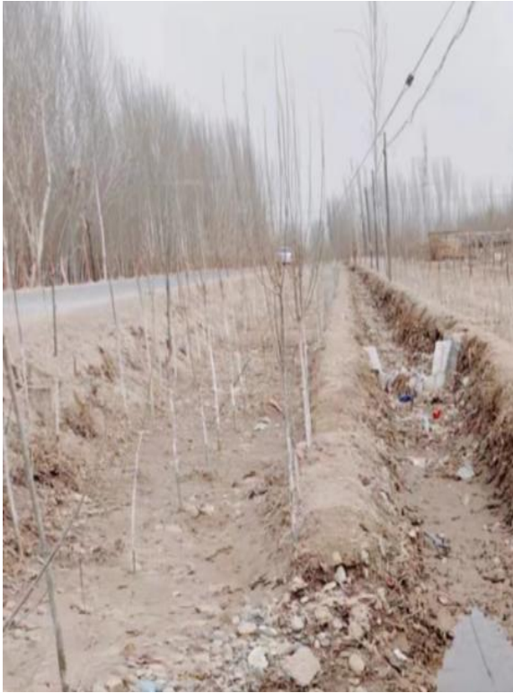
项目所在区域现状