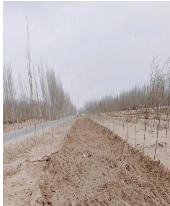
项目所在区域现状