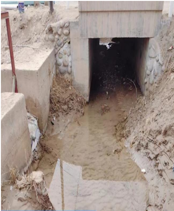
项目所在区域现状