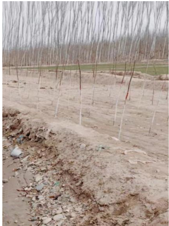
项目所在区域现状