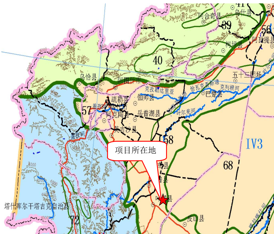
图 3-1 本项目在生态功能区划中的位置图