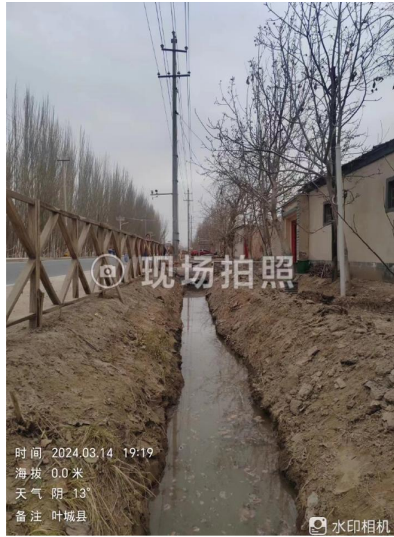
项目所在区域现状