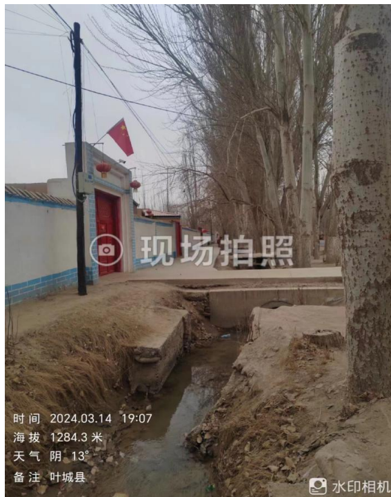
项目所在区域现状