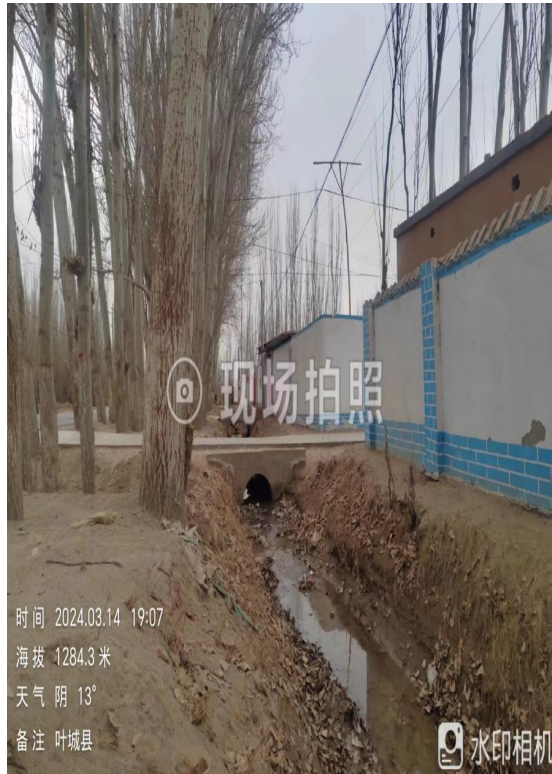
项目所在区域现状