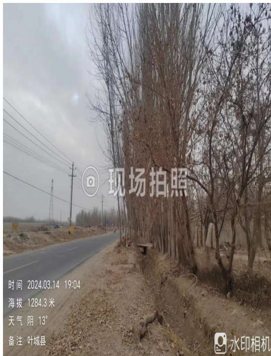
项目所在区域现状