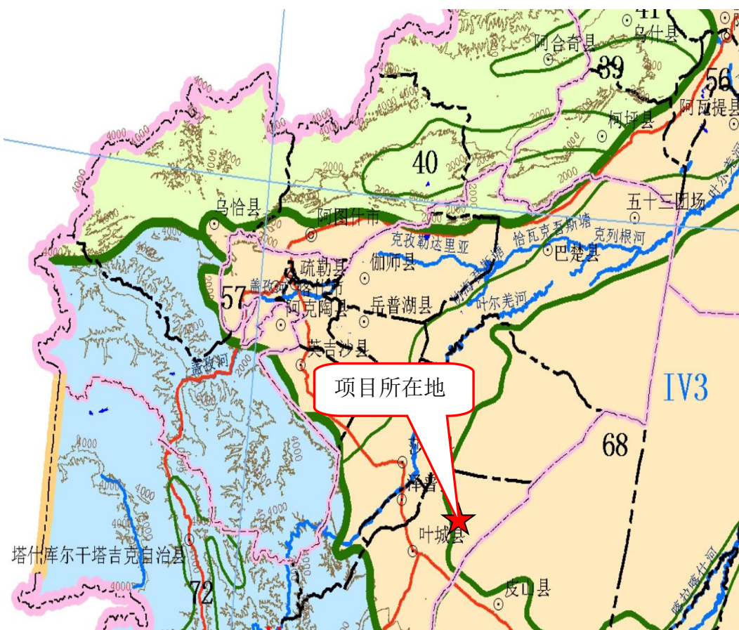
图 3-1 本项目在生态功能区划中的位置图