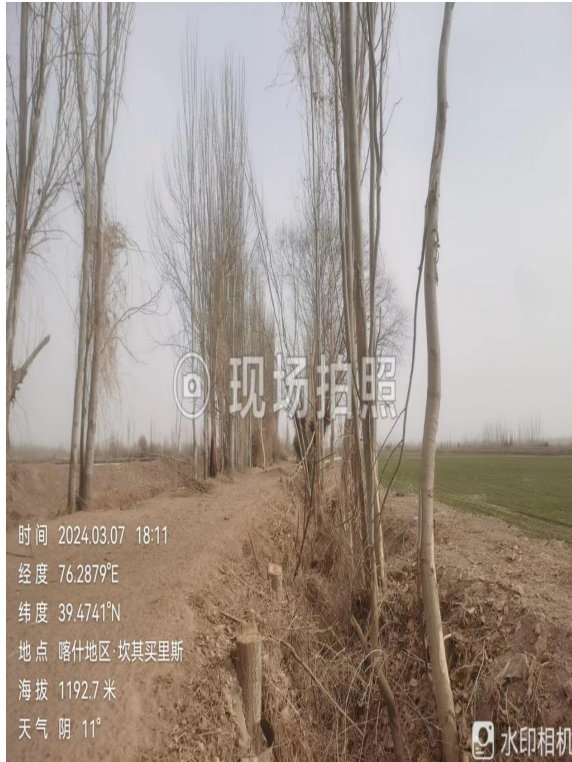
项目所在区域现状