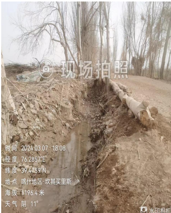
项目所在区域现状