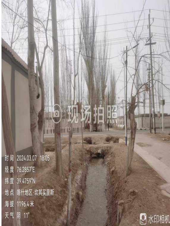
项目所在区域现状