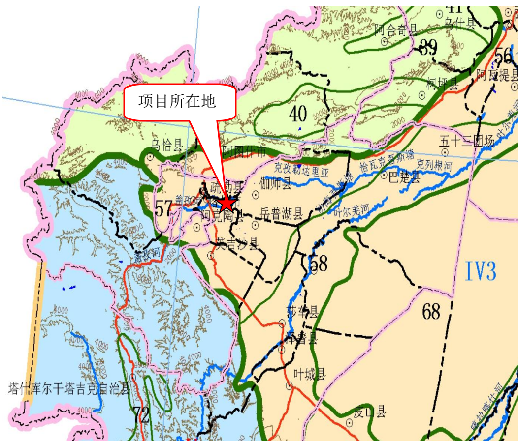
图 3-1 本项目在生态功能区划中的位置图