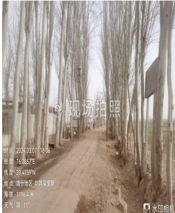
项目所在区域现状